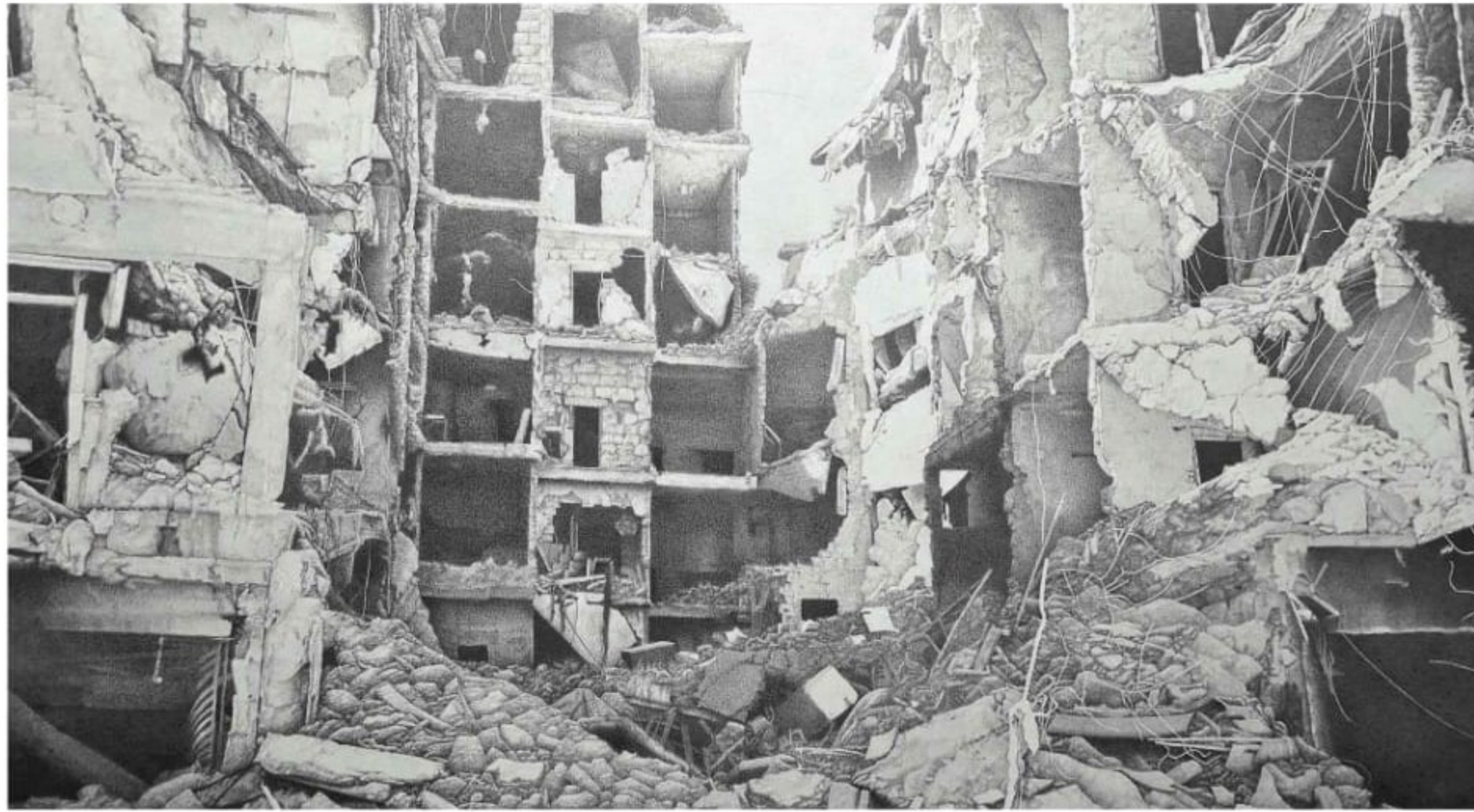
אמיר תומשוב, "חלל: אפס מספר 5", 2020. הרישום שנרכש על ידי מוזיאון תל אביב

הצופה עלול לחשוב שזה תי"עוד מעוזה, הוא אומר, אבל "חלל אפס" היא סדרה שמנתקת את האירועים מהמקום. כל פריים ברישומים המדויקים להפליא שלו נלקח מלוקיישנים בהווה ובעבר — מברלין, מחומס בסו"ריה, מרוסיה ועוד — אבל הם נראים מתאימים לכל מקום. הת"שובה למי ששאלו אם זה מעוזה