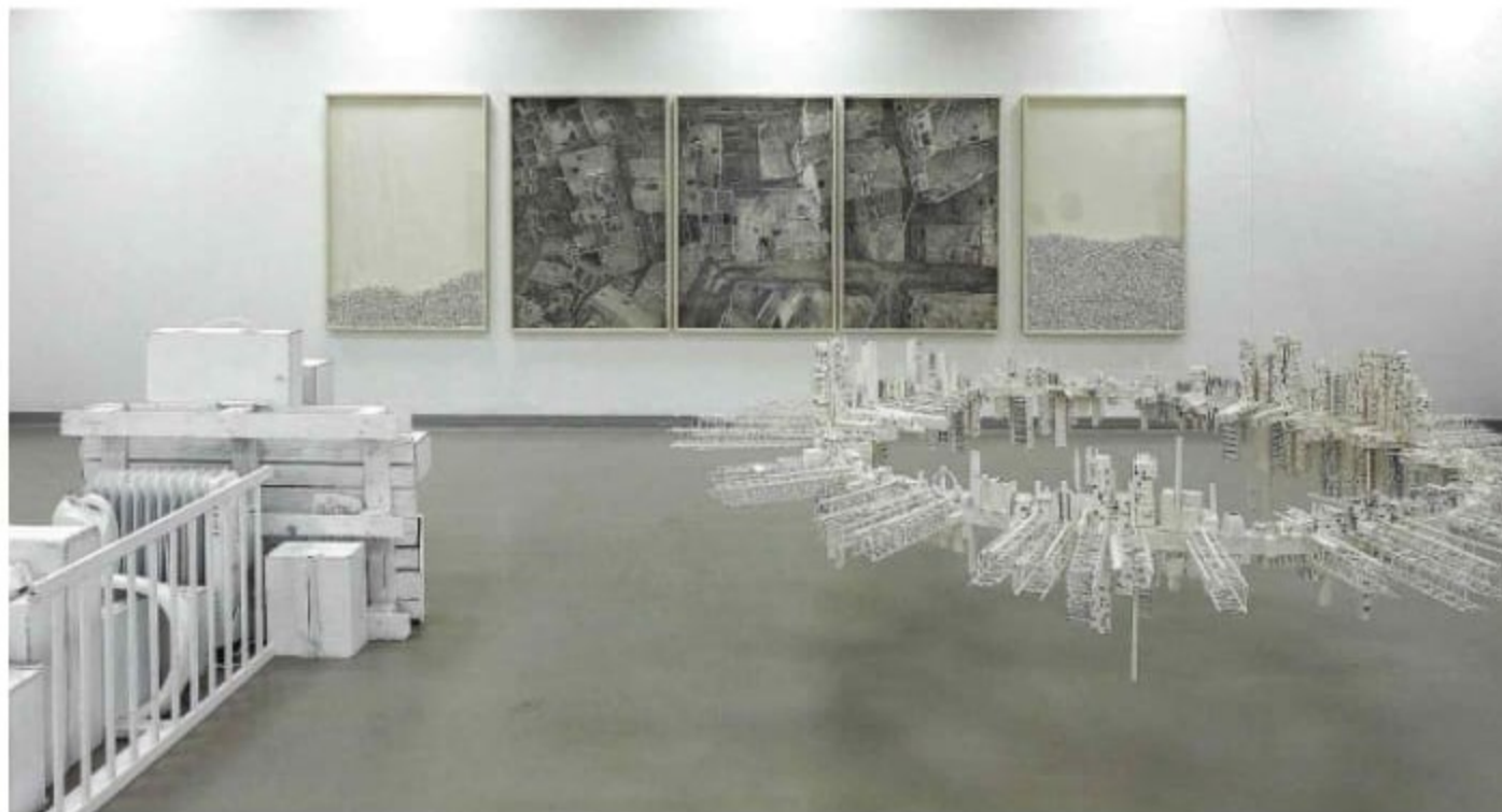
מראה הצבה: "מיצב פוסט טראומה מספר 19", 2022. במוזיאון פתח תקוה

מה היתרון שלך כאדריכל על אמנים שלמדו אמנות פלסטית? "אני לא רואה יתרון או חיסרון בהכשרתי כאדריכל. אבל יש כמה הבדלים. אני די אוטוסיידר בעי"סוקי באמנות כי למעשה לא עבר"תי הכשרה אקדמית לכך. עם זאת, זו פריזמה שניסיתי להרחיב ככל הניתן באמצעים שניתנו לי בח"ממה האקדמית. המיפויים למ"ציאות שלמדתי לעשות הקנו לי יכולת לנטרל סינדרומים כמו עיוורון פסיכולוגי, ולשאול יותר איפה אני נמצא ולא רק מה הש"עה — כדברי זור' פרק. חוץ מזה", הוא מוסיף בסרקום קל, "כאדריכל כבר צילתי עמוק לתוך עולם הייסורים כך שדי מאמינים לי