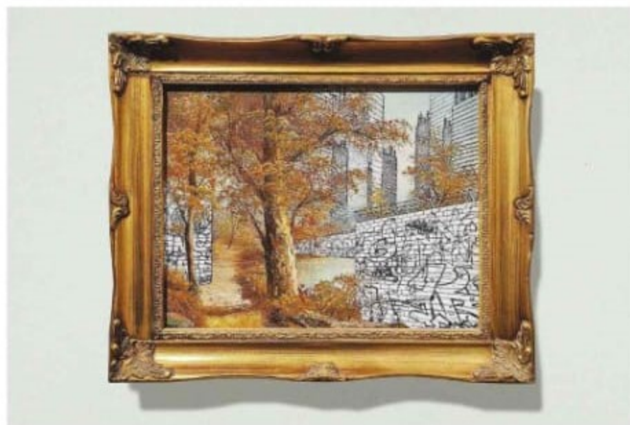
אמיר תומשוב, "נשכח בשנית מספר 6", 2024

שאני אמן מיוסר למרות מיקומי בתחתית שרשרת המזון".